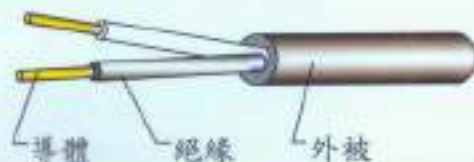
表二 600V 二心聚氣乙烯絕緣及被覆電纜(VV-LF) 符合 CNS 3301C2D58 規定且通過 Rolls 檢測合格